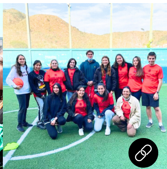
Justícia Activitats a presons