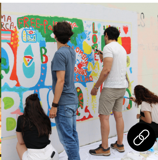
Acollida a persones refugiades