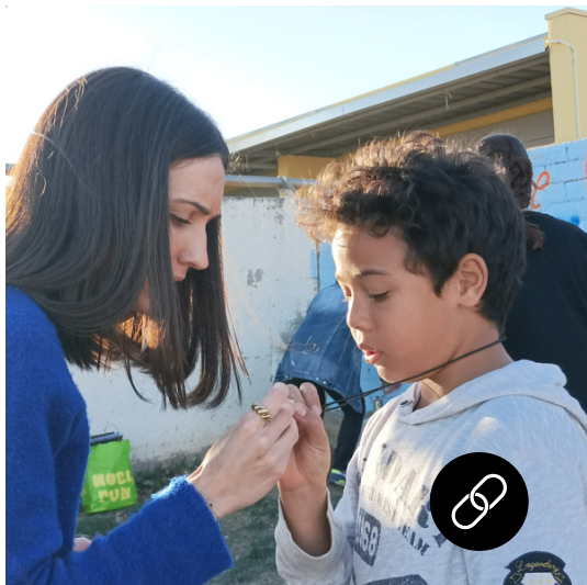
CROMA 2.0 tallers per a infants en risc