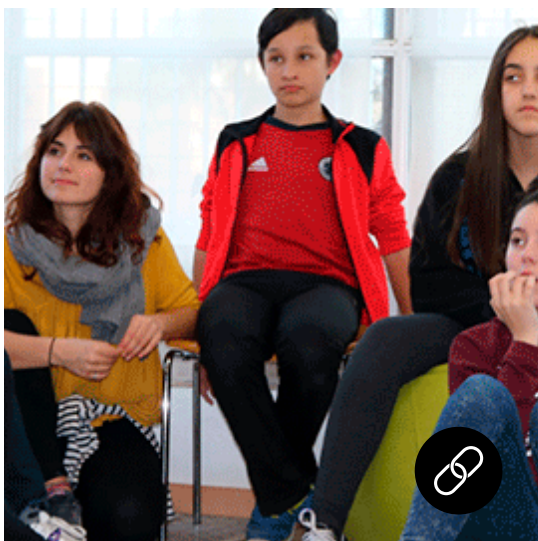
Let's Talk per millorar la competència oral de l'anglès