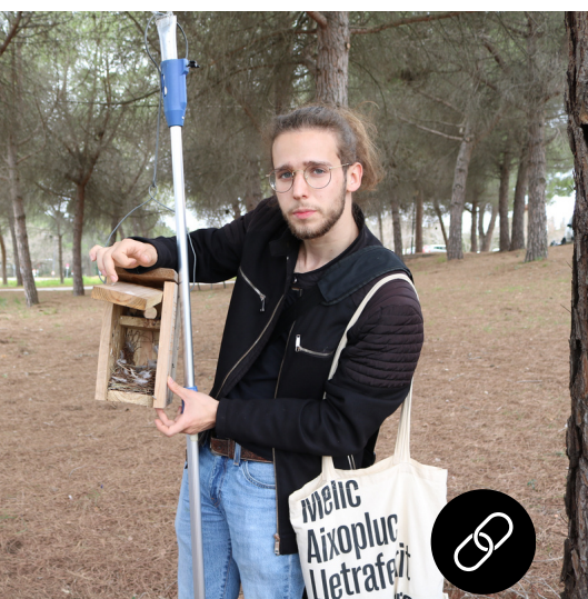
Medi ambient Per un campus sostenible