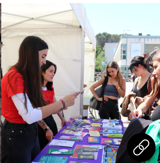
Promoció de la Salut al Campus