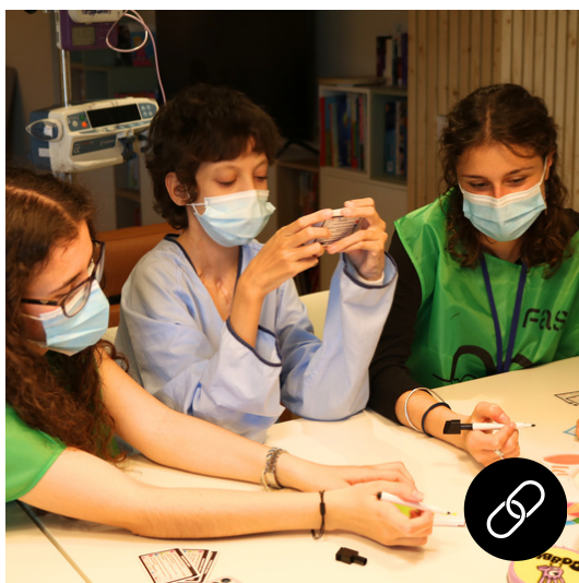
Sociosanitari Acompanyament a persones ingressades